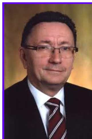
Latvijas Universitātes Datorikas fakultātes dekāns, profesors

Vēl ne tik senos laikos augstas kārtas cilvēki, nespējot pildīt godaprāta prasības, nošāvās. Savukārt, zemnieku kārtai apčakarēt kungu vai kaimiņu bija pati par sevi saprotama lieta. Kurai kārtai piederētu mēs, ir katra paša morāla izvēle.